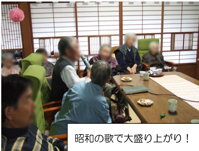
昭和の歌で大盛り上がり！