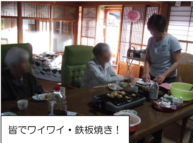
皆でワイワイ・鉄板焼き！