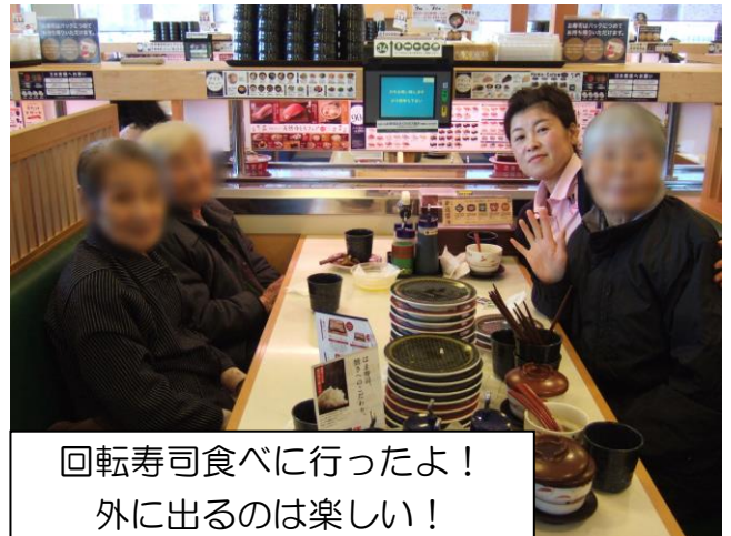
回転寿司食べに行ったよ！ 外に出るのは楽しい！