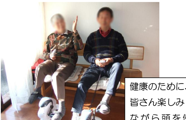
健康のために、 皆さん楽しみ ながら頭を使っ たり、体を動かし たりしています。