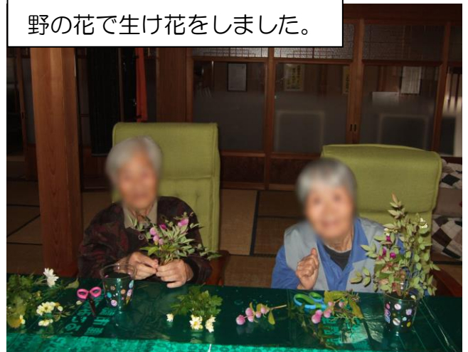
野の花で生け花をしました。